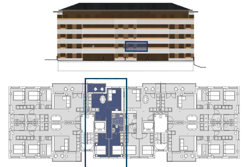
VIVIENDA PORTAL 1 Planta 1ª Letra "A"